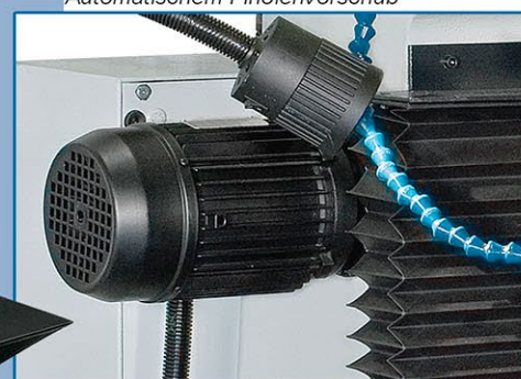
Sollevamento motorizzato del gruppo tavola • Motorisation verticale de la table • Z axis motorized movement • Z Achse Bewegung mit Motor