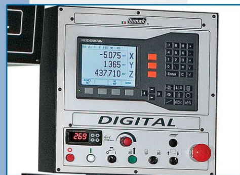
Visualizzatore di quote a 3 assi • Affichage digitale des 3 axes • 3 axis digital read-out • Digitalanzeiger für 3 Achsen