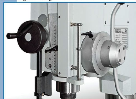
Impianto di maschiatura semiautomatico • Système de taraudage semi-automatique • Semi-automatic tapping system • Gewindeschneidenrichtung