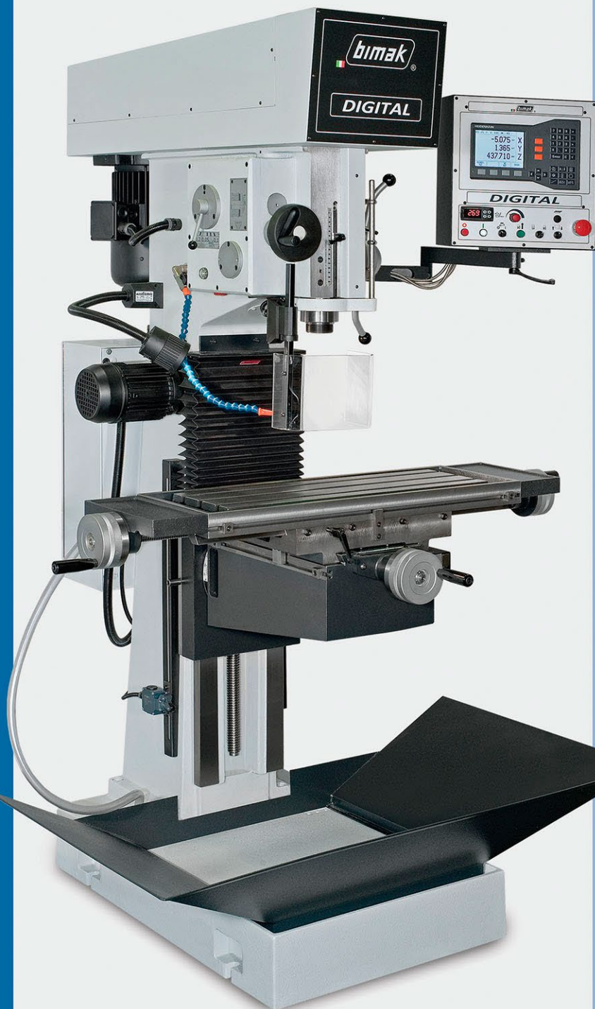
45 AC/M Digital

info@tiekstratechniek.nl - www.tiekstratechniek.nl