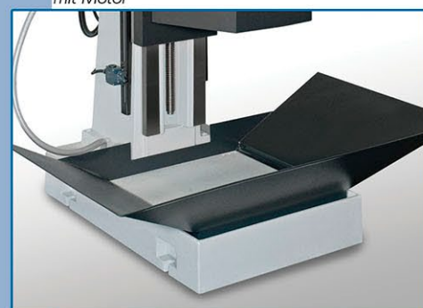
Vasca raccogli trucioli • Bac de récupération • Chip tray • Wanne für Späne