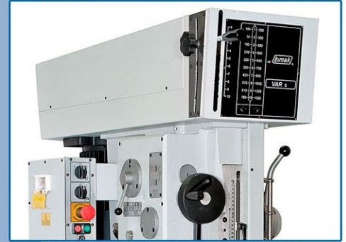
VAR.S (Variatore semplice) • VAR.S (Variateur par courroie) • VAR.S (Toothed belt speed variator) • VAR.S (Stufenlos)