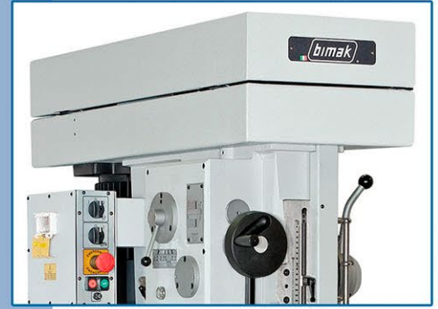
Versione pulegge a gradini • Version avec poulies • V-belts version • Stufenscheiben Modell