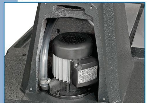
Impianto di refrigerazione • Système d'arrosage • Cooling system • Kuehlanlage