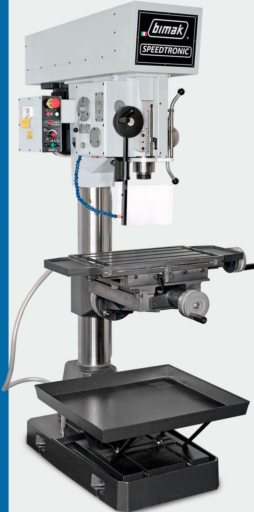
40 TAF/C Speedtronic

Tiekstra Techniek Metaalbewerkingsmachines en toebehoren Wulpstraat 13 - 9363 GK - Marum - Tel 0653734259 info@tiekstratechniek.nl - www.tiekstratechniek.nl