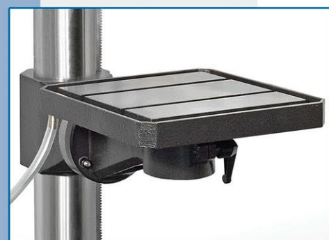
Tavola piana (35 MQ) • Table plat (35 MQ) Flat table (35 MQ) • Normal Tisch (35 MQ)