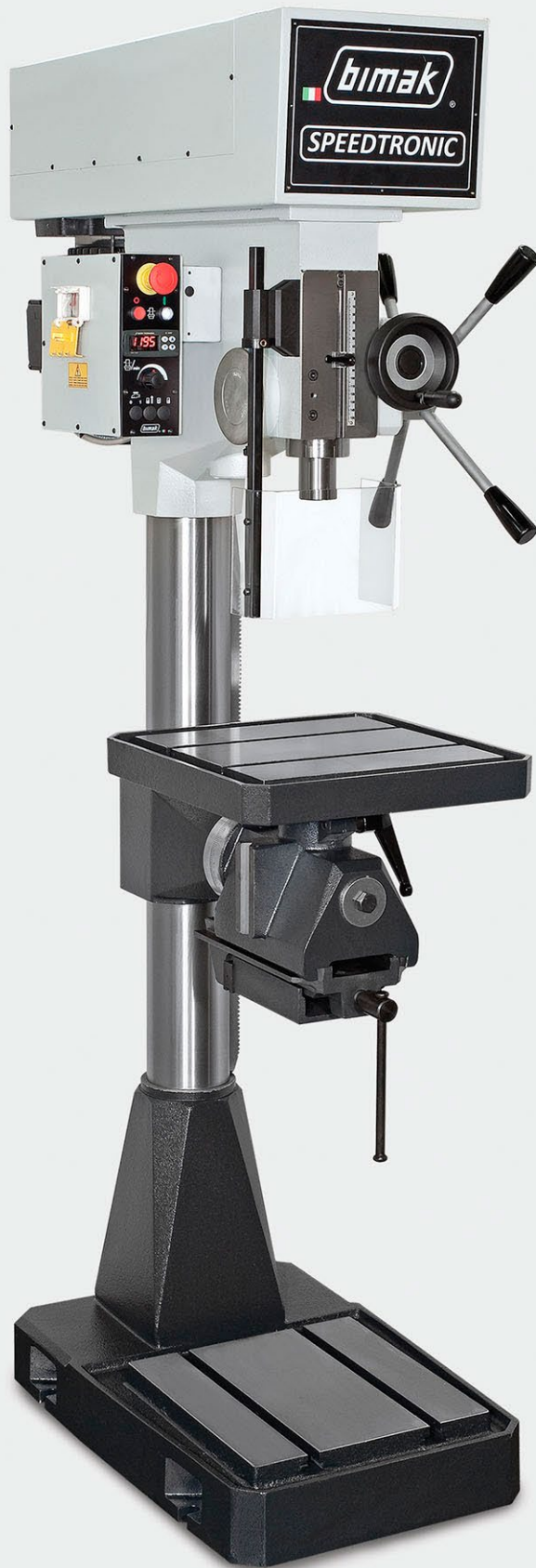
35 ME Speedtronic