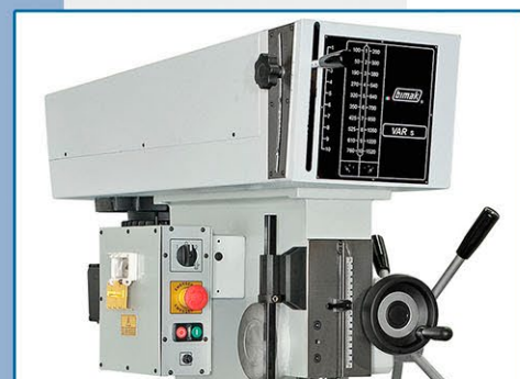
VAR.S (Variatore semplice) • VAR.S (Variateur par courroie) • VAR.S (Toothed belt speed variator) • VAR.S (Stufenlos)