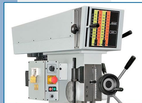
VAR.R (Variatore ritardo) • VAR.R (Variateur par engrenages) • VAR.R (Speed variator with gears) • VAR.R (Stufenlos mit Getriebe)